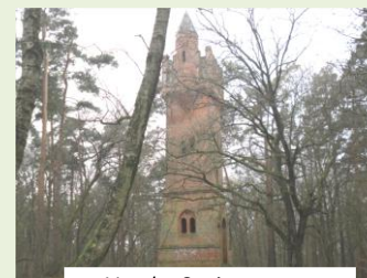
Vor der Sanierung

2010 befand sich der Salzwedeler Bismarckturm in einem bedauerlichen Zustand. Der im Jahr 2011 gegründete