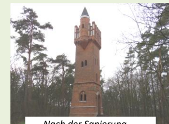
Nach der Sanierung

„Man mag Bismarck lieben oder hassen, so muss doch immer zugestanden werden, dass intellektuell dasselbe von ihm gilt, was in physischer Beziehung von ihm gesagt worden ist: ein gewaltiger Mann!“