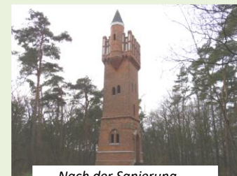
Nach der Sanierung

dazu begann die Suche nach Sponsoren und Finanzierungsmöglichkeiten. Die Hochwasserkatastrophen 2013 sollten die in Aussicht gestellten Förderungen noch einmal verzögern. 2014 konnte die bauliche Instandsetzung mit Hilfe von EU-Mitteln ( Leader Programm ), einer Lotto-Toto-Förderung, der Sparkasse Altmark West, der „Stiftung Zukunft Altmark“, vielen gesammelten persönlichen Spenden und mit der Unterstützung durch die Stadt und den Altmarkkreis beginnen. Für die Bauausführungen zeigten sich die Firmen Behnert Bau ( Lindstedt ), Planungsring Altmark GbR, Metallbau Willi Schneider (beide Salzwedel ) und Naturstein